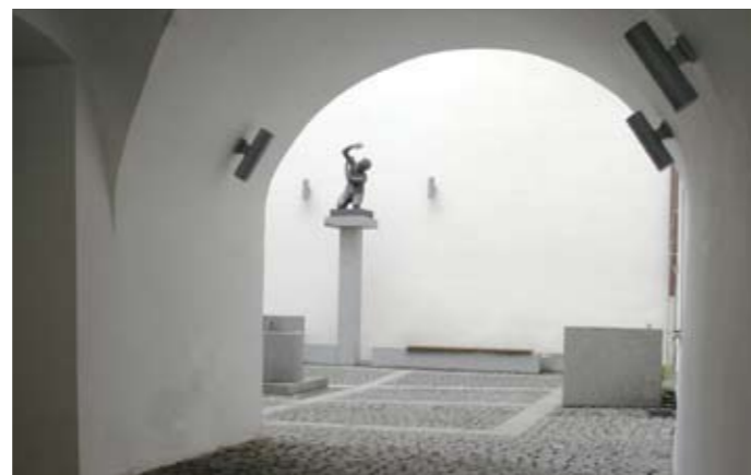
model a realizace