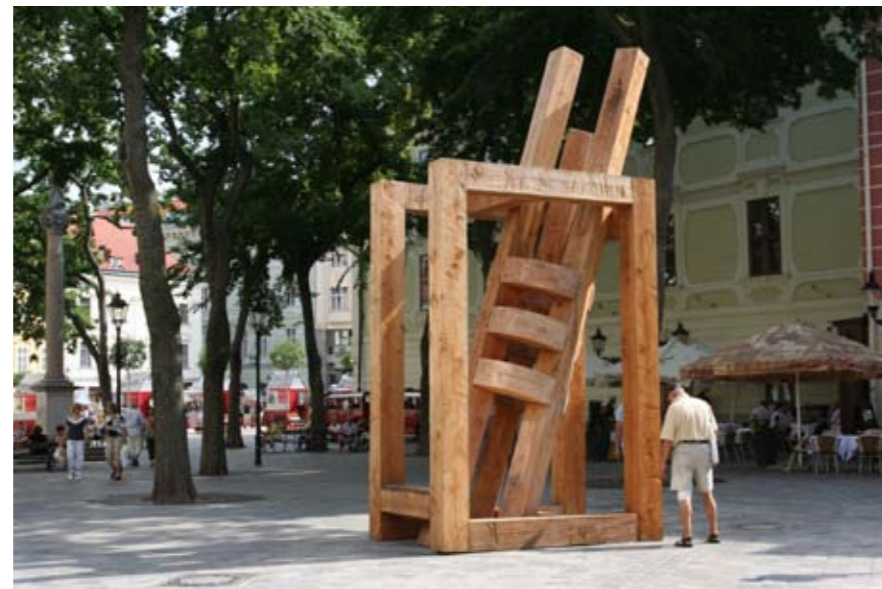
2008 – BRATISLAVA "SOCHY VE MĚSTĚ" (SR)