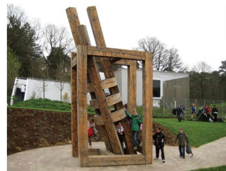
2012 – VENLO (HOLANDSKO/NETHERLANDS) FLORIADE, WORLD HORTICULTURAL EXPO 2012