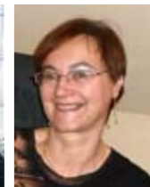
Jarmila Havlíčková překlady a korektury