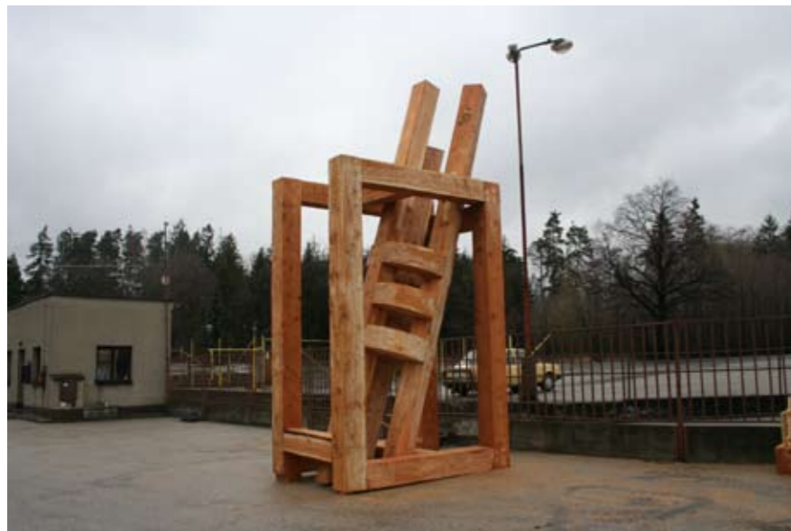
2008 – HLUBOČEC (CZ)