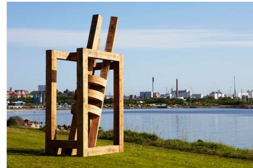
2011 – AARHUS 2011 (DÁNSKO/DENMARK) SCULPTUREBY THE SEA