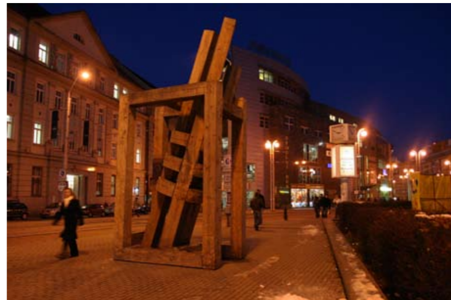
2008 / 2009 – LIBEREC (CZ) SCULPTURE FORUM WINTER